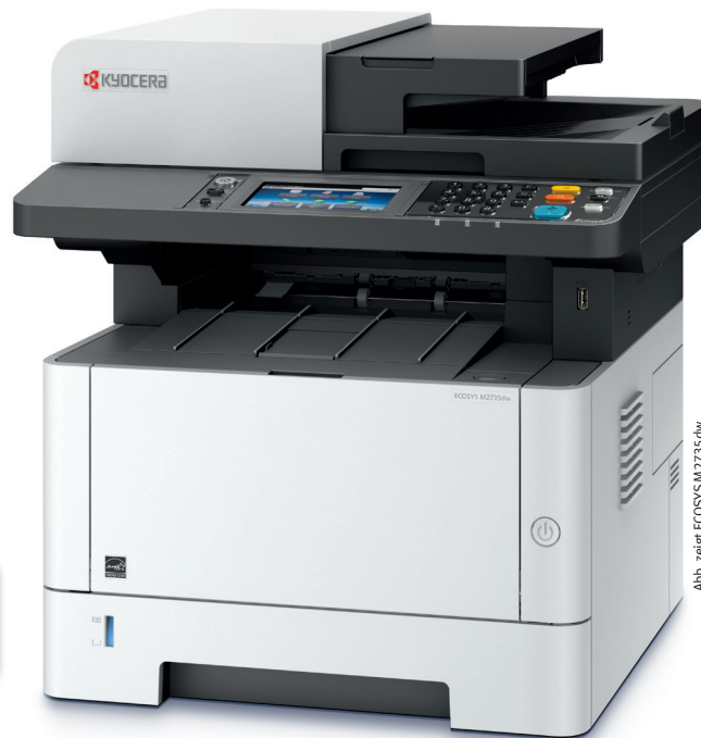
Abb. zeigt ECOSYS M2735dw.